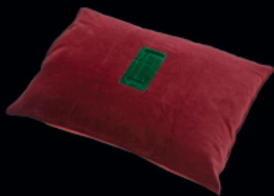
Sny 1 / textilní objekt / 1993