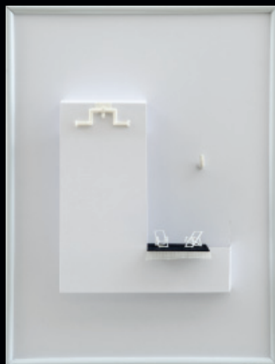
Předmětnosti (odpočinek) / nástěnný objekt / 2009