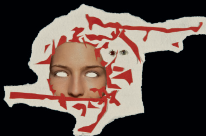
Obklopení osoby v jednání a promlouvání / z cyklu jednání / koláž / 2009