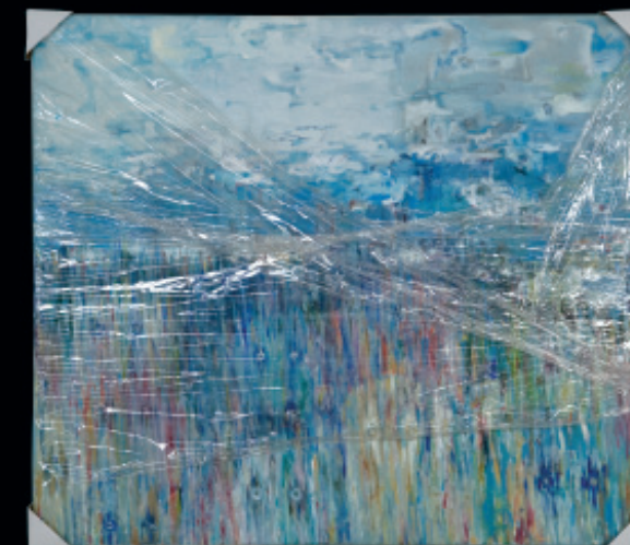
City zabalené do igelitu / olej na plátně / 2008