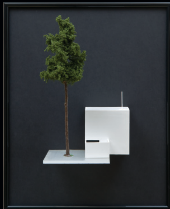
Předmětnosti (romantické vize 1) / nástěnný objekt / 2009