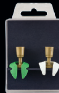
Tchýně a tchán / nástěnný objekt / 2009