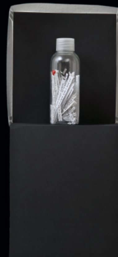
Odpovědi na nepoložené otázky / nástěnný objekt / 2009