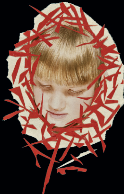
Křehkost lidských záležitostí / z cyklu jednání / koláž / 2009