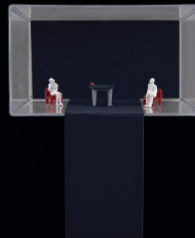
Poslouchat a neslyšet / nástěnný objekt / 2009