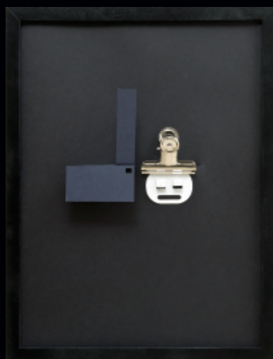
Pan v klobouku / nástěnný objekt / 2009